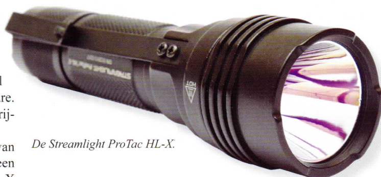
De Streamlight ProTac HL-X.

De HL-X wordt bediend met een schakelaar in de bodemkap. Hij is via Streamlight's Ten-Tap programmeerbaar in drie standen. Standaard staat de lamp ingesteld op high/strobe/low, maar de gebruiker kan wisselen naar alleen high of low/medium/high. De lamp schakelt tussen de