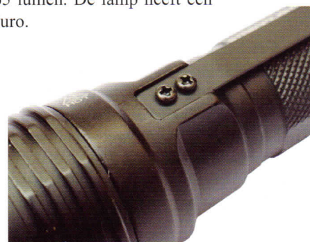
De draagclip zit met twee schroefjes vast.

verschillende stand door de schakelaar snel achter elkaar iets in te drukken. In de laagste stand geeft de HL-X nog altijd 65 lumen. De lamp heeft een adviesprijs van 135 Euro.