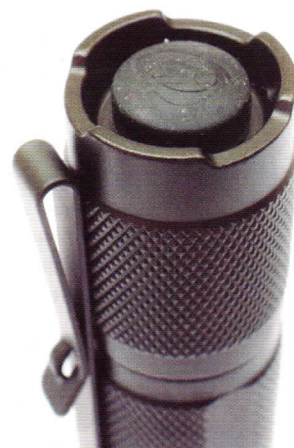
De schakelaar ligt iets verzonken in de bodemkap.