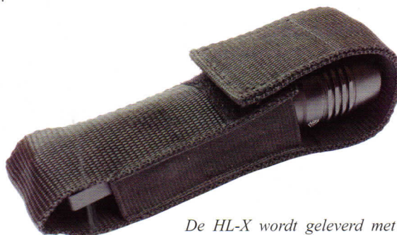
De HL-X wordt geleverd met een nylon foedraal.

Dual Fuel. De HL-X werkt zowel met CR123A batterijen als een oplaadbare 18650 lithium-ion accu. Het kleine verschil in diameter maakt niet uit.