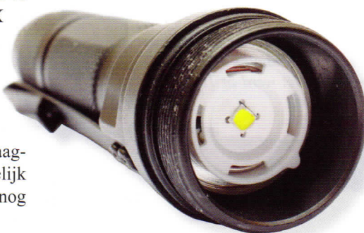
De C4 led is zichtbaar als de lampkop wordt losgeschroefd.

verschillende stand door de schakelaar snel achter elkaar iets in te drukken. In de laagste stand geeft de HL-X nog altijd 65 lumen. De lamp heeft een adviesprijs van 135 Euro.