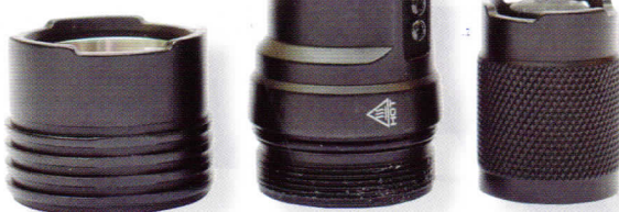
De hoofd delen van de lamp. Van links naar rechts lampkop, huis en bodemkap.